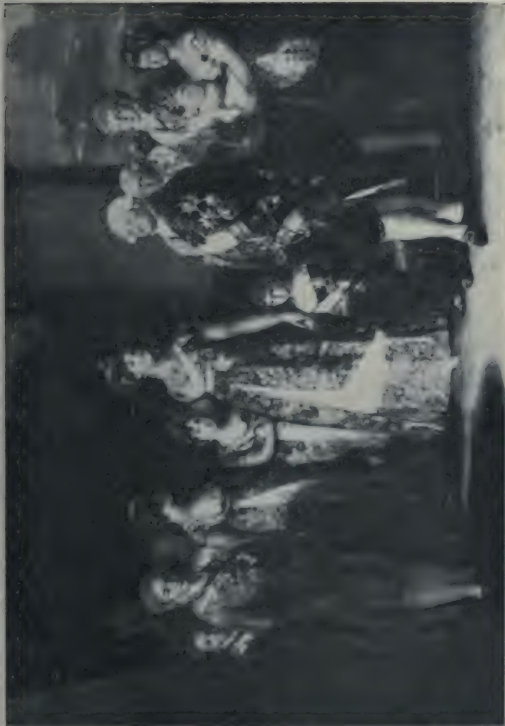
La famille du roi Charles IV.

Peinture de Francisco Goya. (Musée du Prado, à Madrid.)